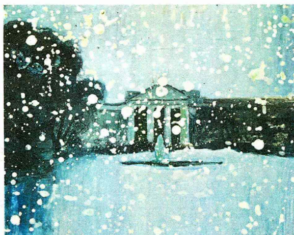
►► Pintura de Jacinta Reyes, estará hoy en Bazart.

► Hoy, de 11 a 20 horas, estará abierta la feria con grabados, fotos y pinturas de más de 40 artistas en el Centro de Extensión UC.