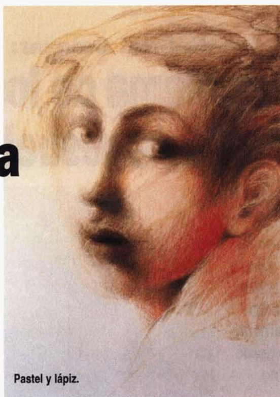
Pastel y lápiz.

En esta oportunidad nos presenta una gama de personajes extraídos de diferentes instancias históricas. Cada una es la heroína de algún momento, envolviéndonos en su aventurero pasado. Sus rostros reflejan penas, alegrías, pesar, angustias y preocupaciones. "Las caras que dibujé no destacan por su sensualidad, sino por su vulnerabilidad de producir placer, angustia, alegría, ensoñación o encanto. Mis mujeres van más allá de la belleza eterna, por eso las presento angustiadas, preocupadas y complicadas", manifiesta.