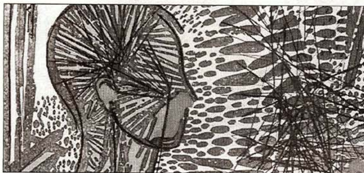
Aguafuertes, aguatinas y buriles. Los presentes grabados de Benjamín Lira convierten el espacio circundante en abstracta y, aparentemente, desordenada fragmentación.

Entre los aguafuertes, aguatinas y buriles expuestos —ediciones nunca superiores a los 60 ejemplares—, una temprana realización de 1978 nos entrega a Lira de cuerpo entero. Pero es a partir de 1990 cuando se alcanza la madurez plena. De esa manera, si el efecto volumétrico de "Nautilus II" (1995) anuncia los futuros rostros de cerámica, en cuatro años posteriores "Sombra" y "Atmósfera" muestran su típica y muy juvenil pareja humana. La segunda ofrece un marcado caos lineal a la altura de los rostros, acaso proyección anímica de un conflicto interpersonal. Del mismo año anterior, la