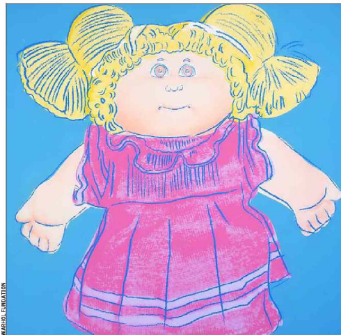
UN MUSEO PARA ÉL — The Andy Warhol Museum es el más grande museo de los Estados Unidos dedicado a un solo artista. Cabbage Patch Girl, pintada en 1985